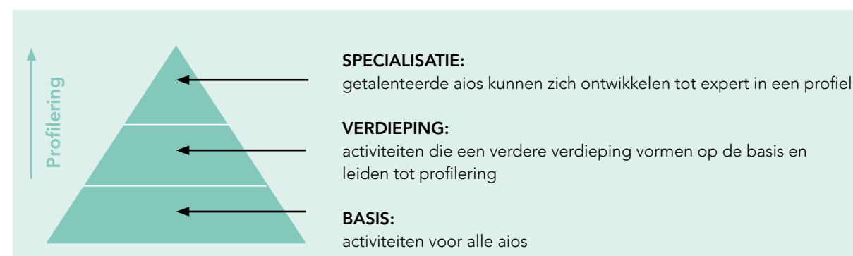
Figuur 1: Ontwikkelniveaus in actuele thema's

In CanBetter is de profilering van aios op thema's weergegeven in een piramidestructuur met drie niveaus.